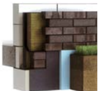
Afdichtingsdetail aansluiting van spouwmuur op kelderwand